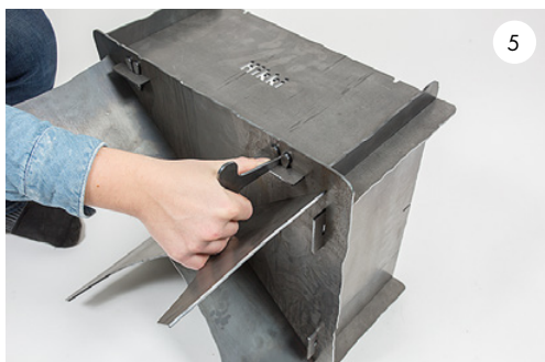
5 Fäst väggplåtarna med hjälp av kilarna. Use the springs to fasten the wall plates.