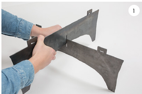
1 Montera ihop benen. Mount the legs.