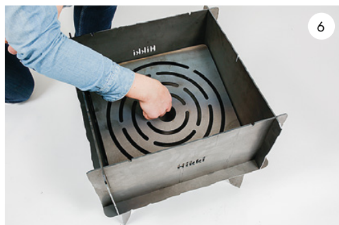
6 Lägg i kolgrillen. Put in the coal grill.