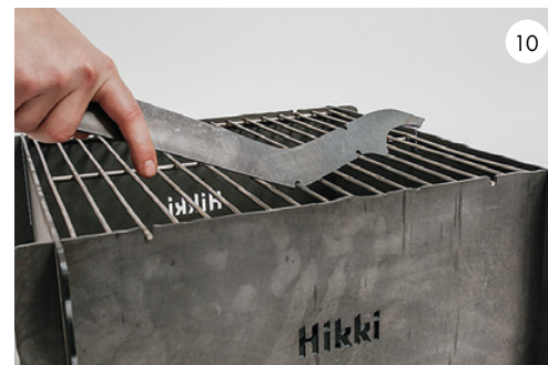
10 Använd det enskilda urtaget för att rengöra gallret. Use the single notch to clean the grate.