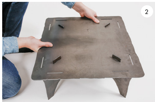
2 Lägg på bottenplattan. Position the bottom plate.