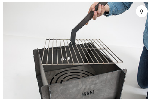
9 Använd den för att lyfta ur grillgallret. Use it to remove the grill grate.