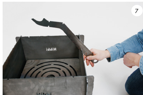
7 Kaffepinnen har flera funktioner. Du kan fästa den i en av väggväggplåtarna... The coffee stick has various functions. You can attach it to one of the wall plates...