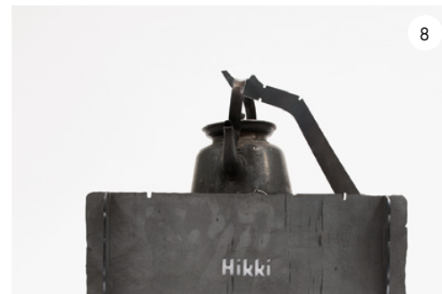
8 ...och hänga på en kaffepanna. ...and hang a coffee kettle over the fire.