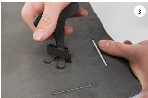
3 Använd det medföljande verktyget för att vrida ut kilarna och på så sätt låsa benen mot bottenplattan. Use the supplied tool to expand the spring, thus fastening the legs against the bottom plate.